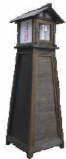
七湯巡りスタンプ塔